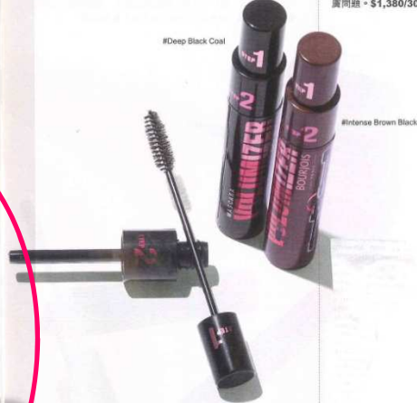
#Deep Black Coal

先擽上 Step 1 具修護功效的 Ceramide、植物蠟及維他 命原 B5 等成分打造的睫毛液分明底霜，勾出根根分明的 睫毛，營造層次。然後將捲刷擽入 Step 2 刷頭再擽在睫毛 上，效果即時變得濃密豐盈，締造分明及卷翹的效果，使雙 目美艷動人。各 $128